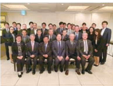
ブロック会後に集合写真

このような状況も踏まえ、組合活動を通して今回の講習等も契機に、どのような行動をしていけばよいか考えていきたいと思っております。