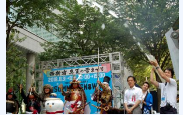
真夏の雪まつり(2018年8月)