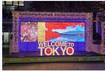
イルミネーション(2019年12月)