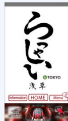
アプリ(らっしやい浅草)