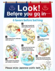
入浴方法案内リーフレット