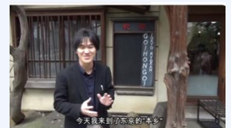
インフルエンサーによる動画配信