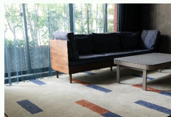
手しごとによるカーペット