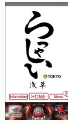
アプリ(らっしやい浅草)