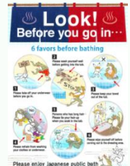
入浴方法案内リーフレット